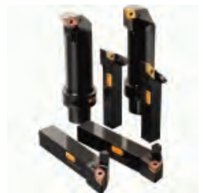
Drehbearbeitung Werkzeuge für die allgemeine Drehbearbeitung