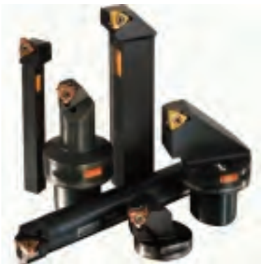
Gewindedrehen Werkzeuge für die Gewindebearbeitung