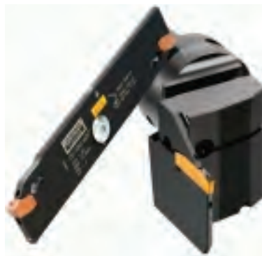
Ab- und Einstechen Werkzeuge für Ab- und Einstechbearbeitungen