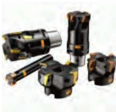
Fräsbearbeitung Werkzeuge für Fräsbearbeitung NEU ab CoroPak 15.1